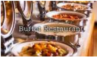
อาหารเย็น : อาหาร บุฟเฟต์ สไตส์ญี่ปุ่น