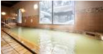
หลังอาหารค่ำ ให้ทุกท่านผ่อนคลายกับการแช่น้ำแร่ธรรมชาติสไตส์ญี่ปุ่น