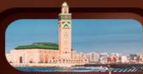
มัสยิดฮัสซันที่ 2