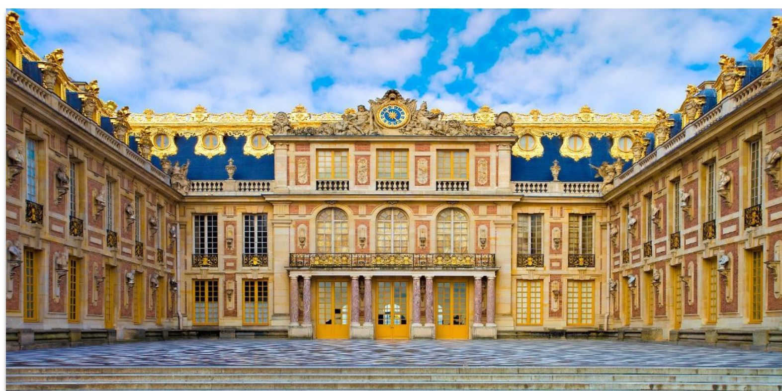
CHÂTEAU DE VERSAILLES

จากนั้นนำท่าน เข้าชมความงามของ “พระราชวังแวร์ซายส์” (Palace of Versailles) หนึ่งในสถานที่สำคัญทางประวัติศาสตร์และวัฒนธรรมของประเทศฝรั่งเศส ซึ่งได้รับการขึ้นทะเบียนเป็น มรดกโลกโดยองค์การยูเนสโก และได้รับการยกย่องให้เป็น หนึ่งในเจ็ดสิ่งมหัศจรรย์ของโลกยุคใหม่ ด้วยความยิ่งใหญ่