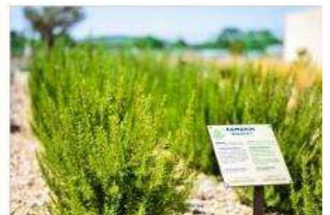
The Mediterranean Garden