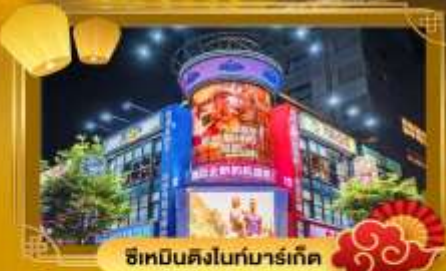
ซีเหมินติงไนท์มาร์เก็ต