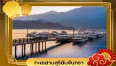
ทะเลสาบสุริยอินจินตรา