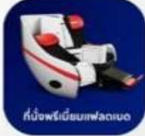
ที่นั่งพรีเมียมเฟลตเบด