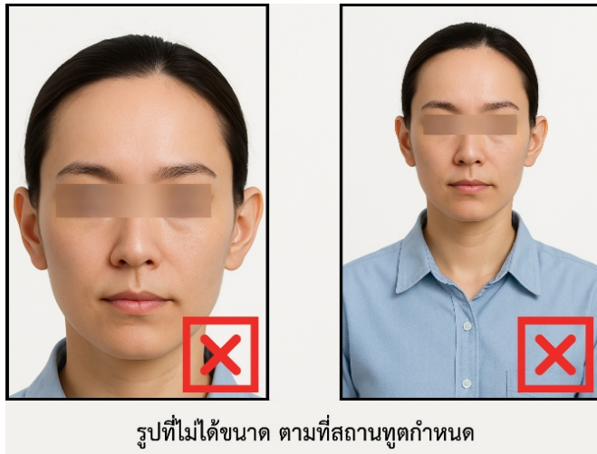
รูปที่ไม่ได้ขนาด ตามที่สถานทูตกำหนด