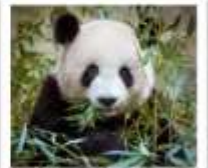
ศูนย์หมีแพนด้าจู่เจียงเยียน