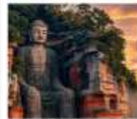
ทิวทัศน์เสื่อซาน