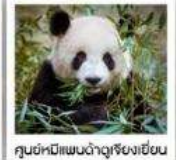
ศูนย์หมีแพนด้าดูเจียงเยียน