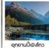
อุทยานปี้เผิงโกว