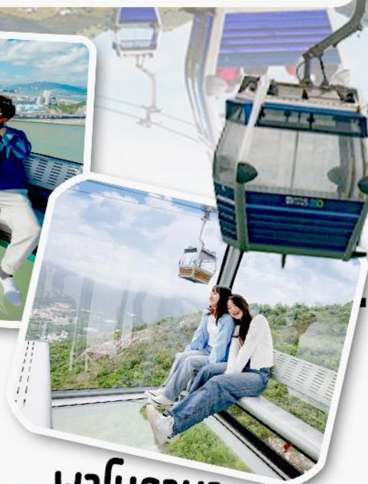
พานิราม่า