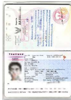
Passport เต็ม 2 หน้า