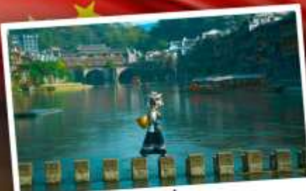
หมู่บ้านเฟิ่งทง

สุดคุ้ม!! พัก 5 ดาว ทุกคืน มนตร์เสน่ห์เมืองเก่า ริมสาងน้ำแจ่มใสแสน