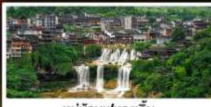
หมู่บ้านฟุทงเจิน