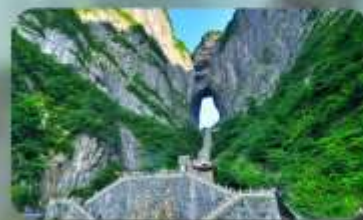
หุบเขาประตูสวรรค์