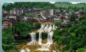
หมู่บ้านฟุทงเจิ้น