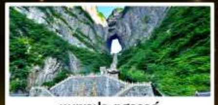
หุบเขาประตูสวรรค์