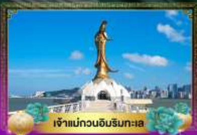
เจ้าแม่ทวนอิมริมทะเล