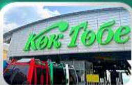
ขึ้นกระเช้าซิมบูลัค

นั่งกระเช้าซิมบูลัค • ทะเลสาบโคลไซ • โบสถ์เซนต์คอป