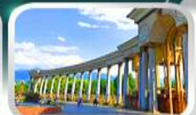
1st President Park