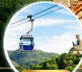
รวมกระเช้าฮ่องกง