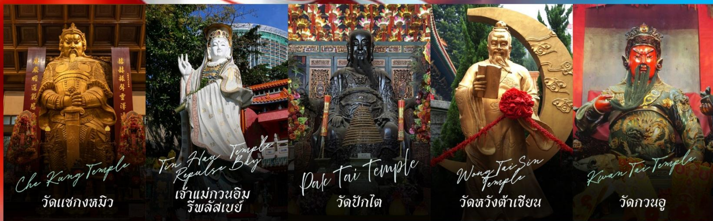
Che Kung Temple วัดแชงทมิว

รายการทัวร์ข้างต้นอาจมีการปรับเปลี่ยนเพื่อความเหมาะสม