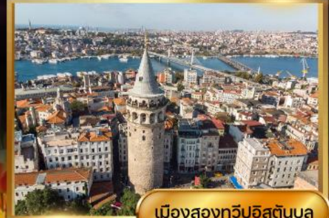
เมืองสองทวีปอิสตันบูล