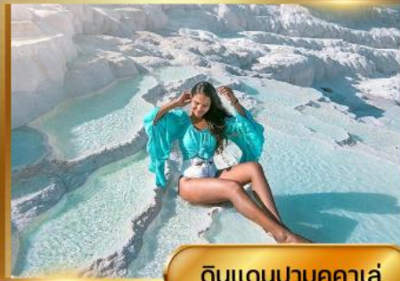
ดินแดนปามุคคาเล่