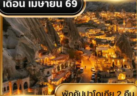
พิศคัสปาดอกเคีย 2 คืน