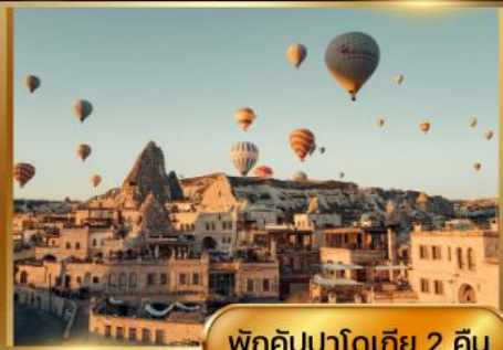
พักคัปปาโดเกีย 2 คืน