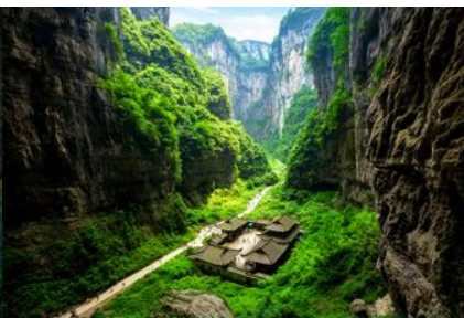
สะพานธรรมชาติสามแห่ง