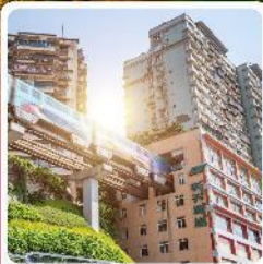
รถไฟฟ้างูตึก