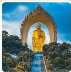
พระใหญ่ตงหลิน