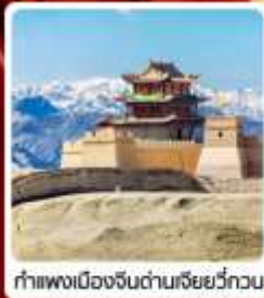
กำแพงเมืองจีนด่านเสี่ยววีกวน

• ไซโล...เส้นทางสายไหม ชมสระบัววังพระจันทร์ ทะเลทรายผิงซาซาน กำแพงเมืองจีนด่านสุดท้าย "เจียยวีกวน" มรดกโลกภูเขาสายรุ้งจางเย่