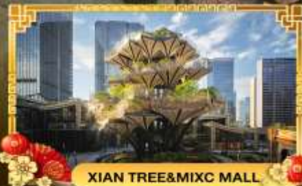
XIAN TREE&MIXC MALL