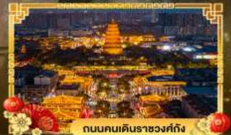
ถนนคนเดินราชวงศ์ถัง