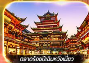
ตลาดร้อยปีเงินหวงเหมียว

เที่ยวดิสนีย์แลนด์เต็มวัน (รวมบัตร + รถรับส่ง) ช้อปปิ้งย่านดัง นานกิง, เงินหวงเหมียว