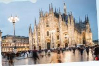
คูโอโม มิลาน