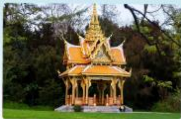
ศาลาไทย ไหลซาน

พิเศษสุดๆ สองเขาเง่าหัวใจ กลาเซียร์ 3000 และ เซอร์แมท