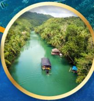
สองเรือแม่น้ำไลบ็อก