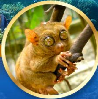
สิงทาร์เซีย