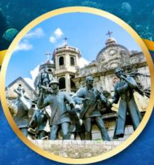
อนุสาวรีย์มรดกแห่งเซบู