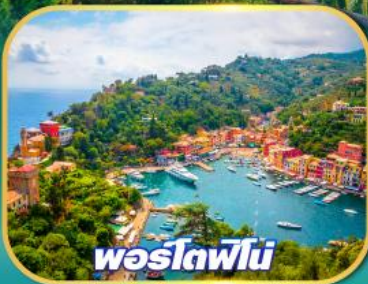
พอร์โตฟีโน