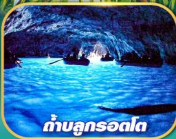
ถ้ำบลูกรอดโก