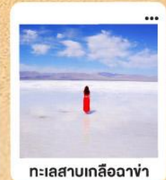
ทะเลสาบเกลือฉาซ่า