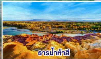
ธารน้ำห้าสี