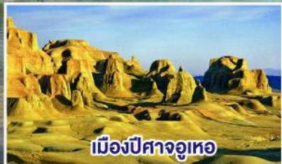
เมืองปีศาจจวูเทอ