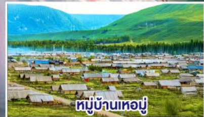
หมู่บ้านหอบู่