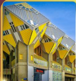
บ้านลูกเต๋า โคกคูนุส

“ล่องเรือหลังคากระจก” ชมกรุงอัมสเตอร์ดัม