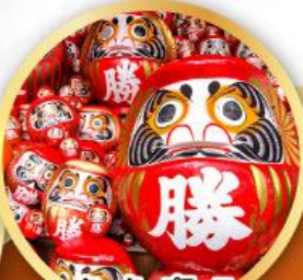
วัดคิตสึโองิ (วัดดาร์มะ)

ชมความงามของกำแพงหิมะ เส้นทางสายอัลไพน์ ทากะยาม่า (JAPAN ALPS SNOW WALL)