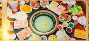
สุกี้เห็ด