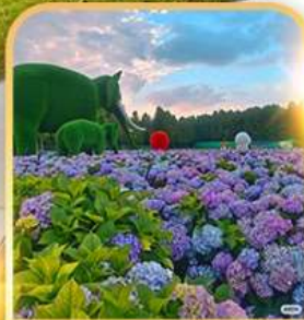
ดอกไม้ตามฤดูกาล