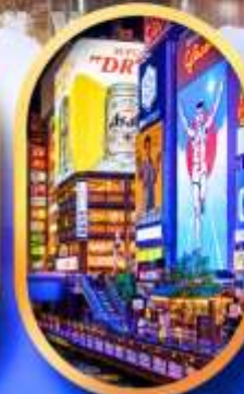
ย่านชิบะโฮนาชิ