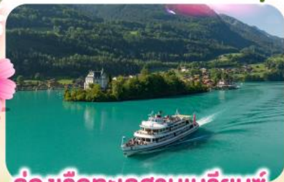
ล่องเรือทะเลสาบเบรียนซ์

พิชิตยอดเขาชุนเนกกา 1 ในเขาที่สวยงามที่สุดเมืองเซอร์แมท