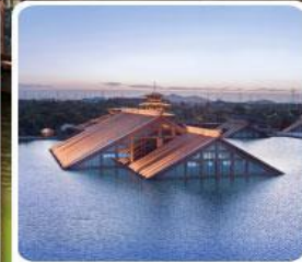
พิพิธภัณฑ์ไดน้ำ กวางฟู่หลิน