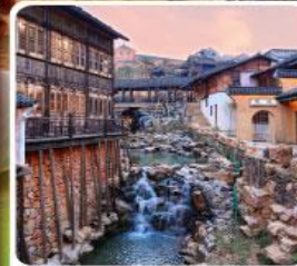
เมืองโบราณเหย่าหู