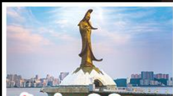
เจ้าแม่กวนอิมริมทะเล