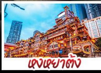
แดงเขย่าถัง