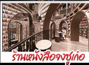
ร้านหนังสือจขูเก้อ