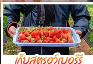
เก็บสตรอว์เบอร์รี่