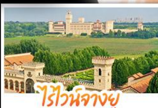
ไรไวน์จางยู