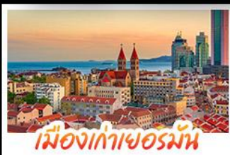
เมืองเก่าเยอรมัน

เมืองเก่าชิงเต่า - สลับกับเมืองโบราณหมิงสุ่ย เมืองเก่าเยอรมัน - ไรไวน์จางยู - สวนสตรอว์เบอร์รี่