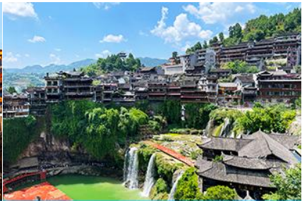
เมืองโบราณฝูหรงจิ้น