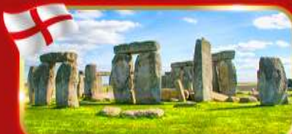
สโตนเฮนจ์ สิ่งมหัศจรรย์ของโลก