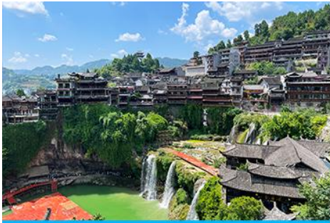
เมืองโบราณ ฝูหรงเจิ้น