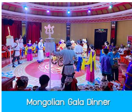
Mongolian Gala Dinner

那达慕 Naadam Festival หรือเทศกาลเฉลิมฉลองที่คล้ายวันตรุษจีนของชาวจีน ประกอบด้วยกิจกรรมการเล่นพื้นเมืองแบบมองโกล รวม 22 อย่าง ได้แก่ พิธีแต่งงานเออร์คอส / การขี่ม้าในสนาม / ปาร์ตี้รอบกองไฟ / ขี่ม้าถ่ายรูป / สไลเดอร์หญ้า / รถลางทุ่งหญ้า / สวนแขวงกต/สวนเด็กเล่น / ตีกอล์ฟทุ่งหญ้า / รถบังคับ / รถโกคาร์ต / โยนบอลทุ่งหญ้า / ปีนไฟมองโก / ยิงธนูในร่ม / แข่งขันจับแกะ / คล้องม้าจำลอง / หมูเลี้ยงน้ำเอ็นดู / เครื่องเล่นหมุน / เลี้ยงแกะโยน / ยิงธนู / ทอยแจกัน / เซ็นต์ชื่อภาษา มองโก ให้เลือกเล่นได้ 12 อย่างตามรายการที่ระบุ.....อัตราค่าบริการสำหรับ 那达慕 Naadam Festival 380 หยวน หรือ 1,900 บาท/ท่าน (สำหรับลูกค้าทัวร์ที่ไม่ซื้อโปรแกรมเสริม สามารถเดินเล่น ถ่ายรูปบริเวณทุ่งหญ้าหรือพักผ่อนตามอัธยาศัย)