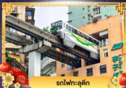
รถไฟกระตุ๊ก