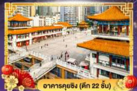
อาคารคุยซิง (ตึก 22 ชั้น)