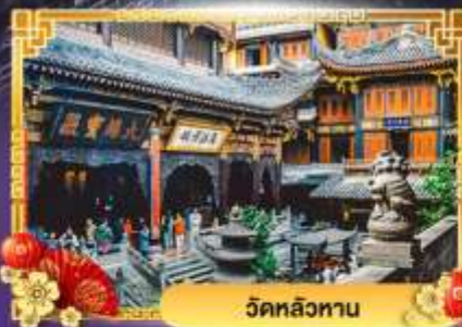
วัดหลิวทาน