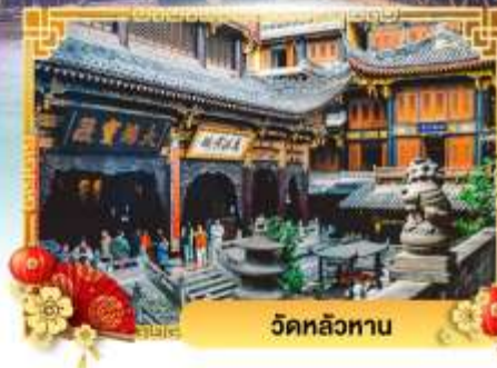
วัดหลัวหนาน