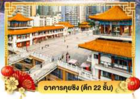
อาคารกุยชิง (ตึก 22 ชั้น)