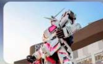
ช้อปปิงโอไดบะ