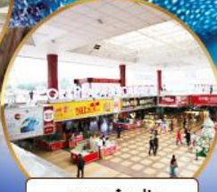
ตลาดกังเป๋ย