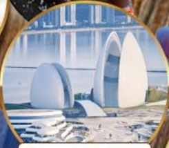
โรงแรมหรูไฮมุก