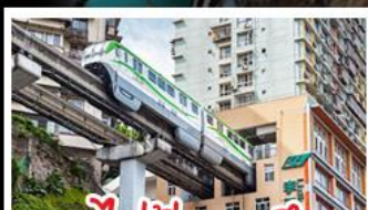
รถไฟไฟทะเลลู่ตีก