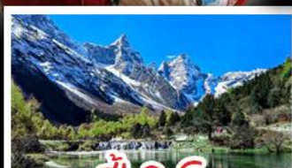
ปี้เฉิงโกว