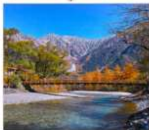
ดามิโดจิ