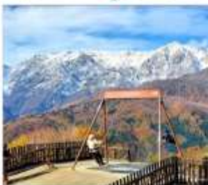
ฮาคูนะอิวาทาเกะ