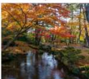
สวนเคนโระคุเซ็น