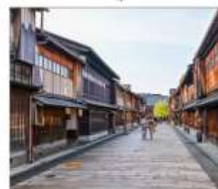
ย่านโรงน้ำชาอิงาชิฮายะ