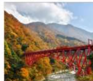
รถไฟชมวิวยุเมเวาคูโรมะะ