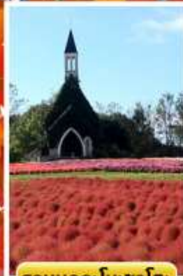
สวนบกกะโนะซาโตะ