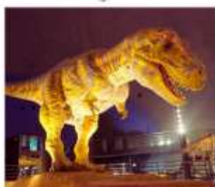
พิพิธภัณฑ์ไดโนเสาร์