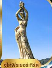
จูไห่ฟิชเชอร์ทรีซ่า