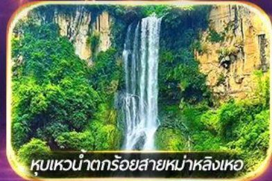
หุบเขาน้ำตกร้อยสายหม่าหลิงเหอ

ชมวิถีชีวิตหมู่บ้านปู้อี้ยามค่ำคืน, ล่องเรือทะเลสาบว่างเฟิงหู ชมสวนดอกไม้ตามฤดูกาล, ซอปปิ้งจูงใจถนนคนเดิน