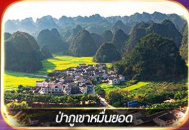
ป่าภูเขาหมื่นยอด