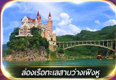
ล่องเรือทะเลสาบว่างเฟิงหู