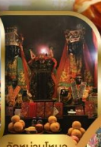
วัดบ้านใหม่