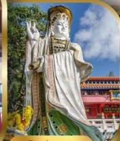
เจ้าแม่กวนอิม ริพลัสเบย์