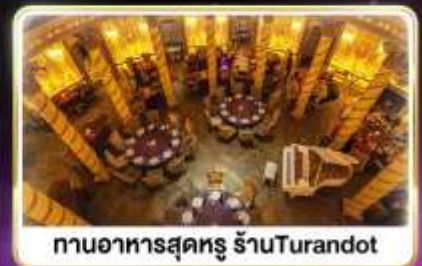
กานอาหารสุดหรู ร้านTurandot