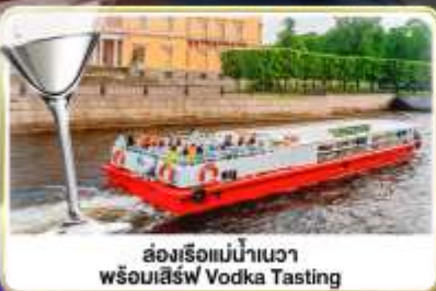
ล่องเรือแม่น้ำแคว พร้อมเสิร์ฟ Vodka Tasting