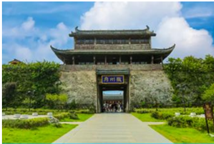
เมืองโบราณฮุยโจว